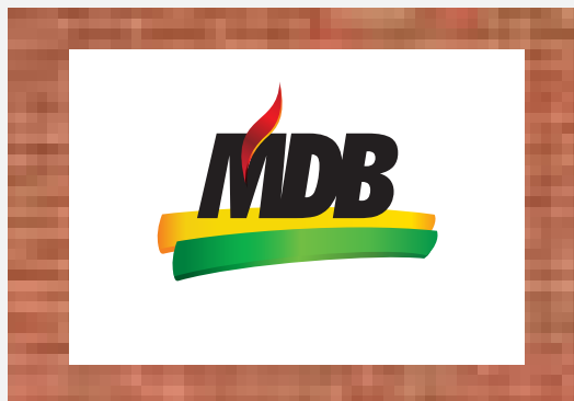
Fundo complexo com imagem